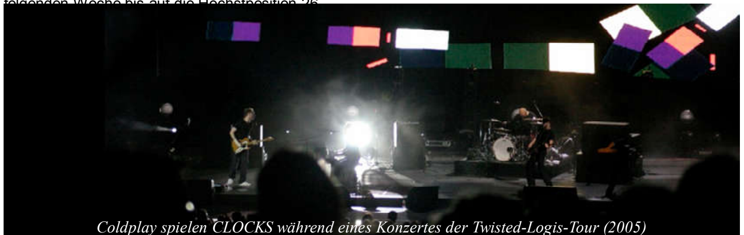
Coldplay spielen CLOCKS während eines Konzertes der Twisted-Logis-Tour (2005)

Das Album ist bis heute mit über 13 Millionen verkauften Exemplaren das kommerziell erfolgreichste Album der Band. Damit steht das Album außerdem auf Platz 13 der weltweit meistverkauften Alben zwischen 2000 und 2009.